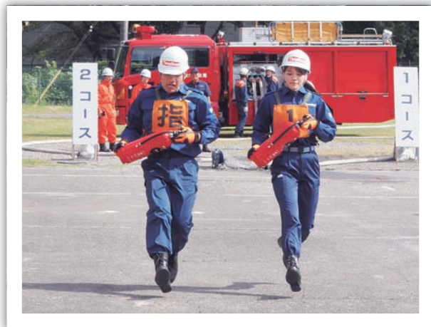
令和元年度 第36回 自衛消防隊消火競技会