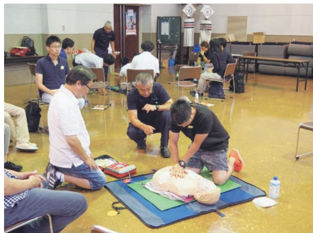
心肺蘇生、AED取扱い訓練