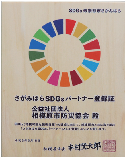
さがみはらSDGsパートナー登録証盾

「さがみはらSDGsパートナー制度」とは、企業、NPO、団体、教育機関、行政等が、SDGsを起点に連携を深め、豊かな自然環境とにぎわいのある街を次世代につなぐための取組を進めたり、一人ひとりの行動変容を促し、SDGsの目指す「誰一人取り残さない」持続可能な社会の実現を目指し、官民一丸となって一緒に取り組んでもらえる企業や団体等を募集するため、令和2年8月17日からスタートしたものです。