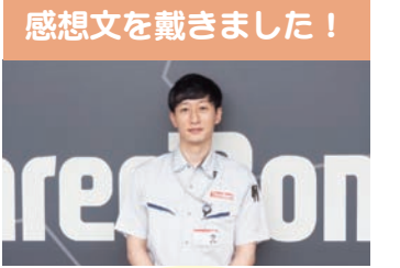
感想文を戴きました！

可能性を列挙すればきりはありませんが、防災は想定内の事しかできないと考えており、想定外を無くすための情報収集や訓練など、最新の危機管理体制の構築が必要であると考えています。