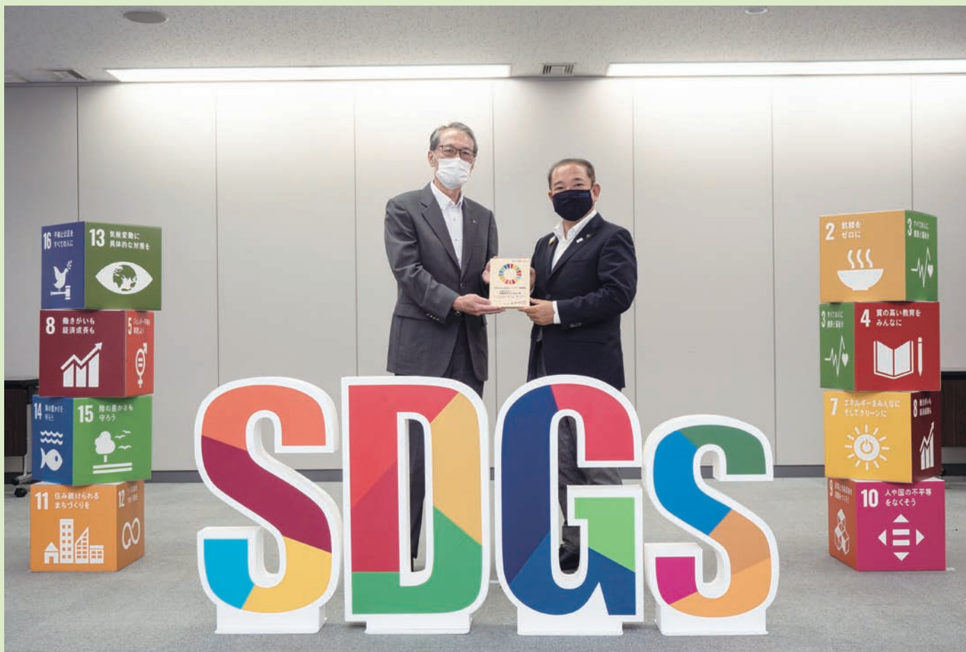
さがみはらSDGs登録証盾交付式(相模原市役所)