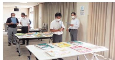
審査風景 (相模原市民会館)