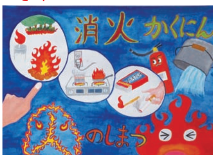
みずうち かいと 水内 海翔さん（九沢小）