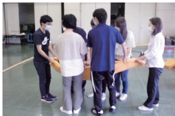
心肺蘇生、AED取扱い訓練