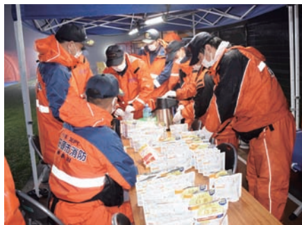
食事(レトルトカレーなど)準備の様子