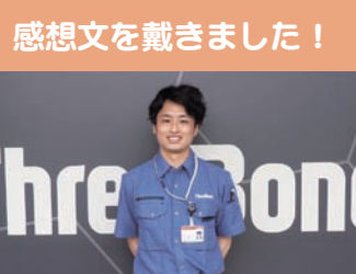
感想文を戴きました！