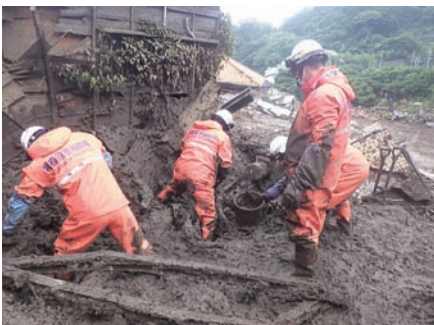
捜索救助活動の様子