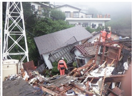
家屋内を捜索する様子