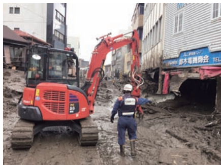
重機を活用した活動