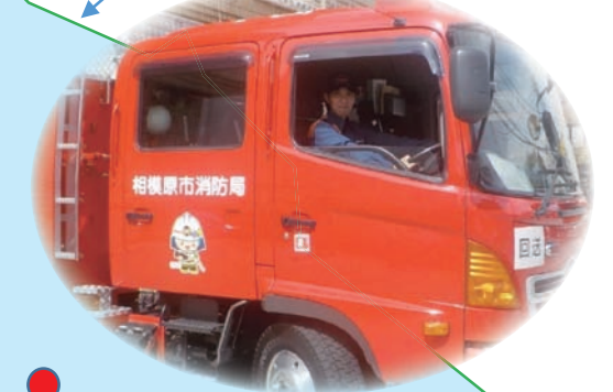
上鶴間分署 点検に伴う車両回送