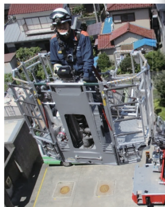
はしご車取扱訓練(30m級)