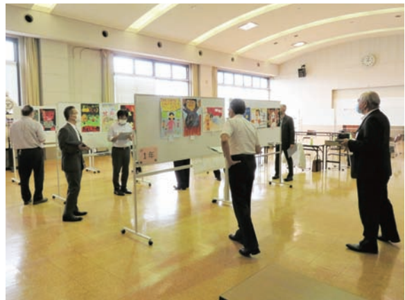
審査風景（消防指令センター）