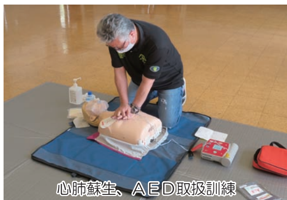
心肺蘇生、AED取扱訓練