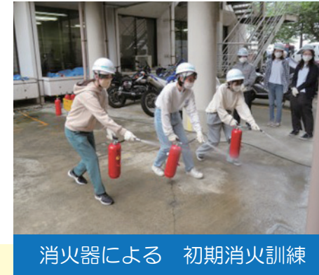
消火器による 初期消火訓練

「企業講習」ってなに？ 防災研修会などを、 各企業・事業所に出向して実施 する取組みです。