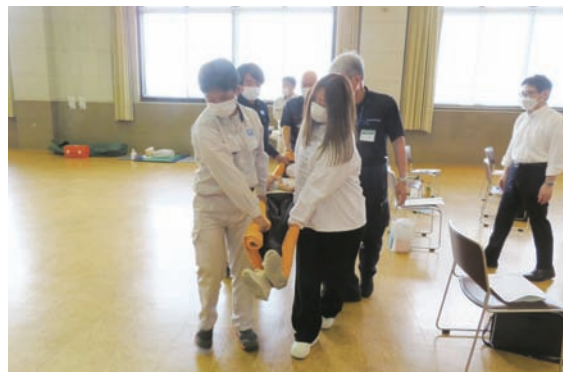
毛布による応急担架搬送