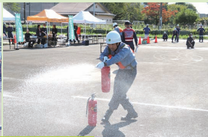
令和5年度 自衛消防隊消火競技会