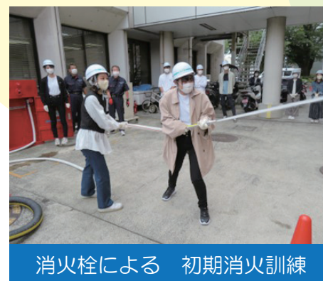
消火栓による 初期消火訓練

研修内容は、講習、各種訓練など、各事業所の状況やご要望に応じて、実施させていただきます。