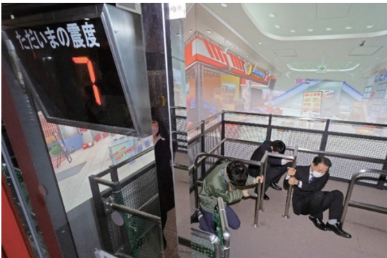
地震体験コーナー

災害時に必要な防災知識や行動などについて、県の総合防災センターを活用して身につけていただくことができます。どうぞご利用ください。