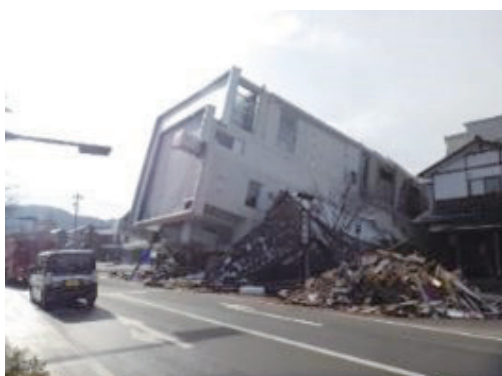
倒壊したマンション