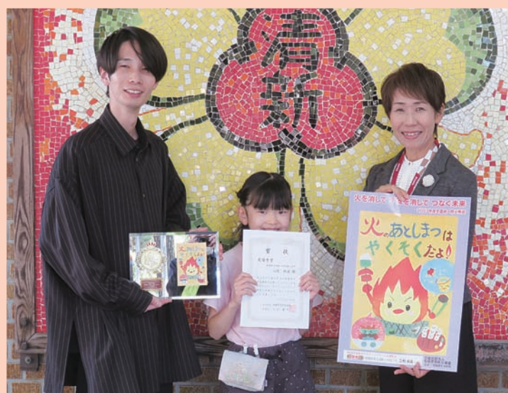
清新小学校の校長先生、担任教諭と撮影