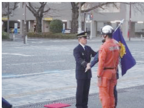
緊急消防援助隊旗授与

被災地に近づくにつれ、倒壊した家屋や崩落した道路が多く目立つようになり、改めて地震の恐ろしさを目の当たりにし、派遣される消防部隊としての責務の大きさを再認識しました。