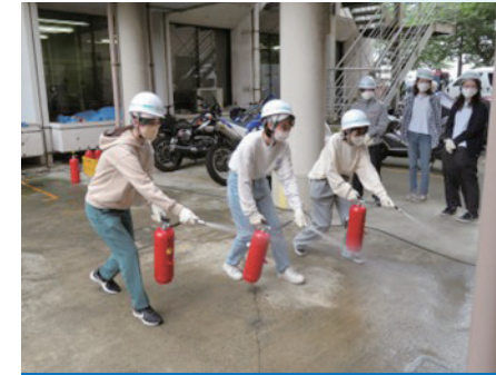
消火器による 初期消火訓練