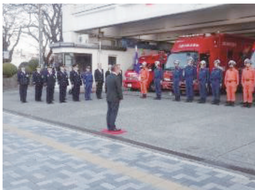
派遣部隊への本村市長訓示

※緊急消防援助隊神奈川県大隊第1次派遣隊として、被災地に必要とされる部隊が、神奈川県内全23消防本部から78隊284名で構成されています。