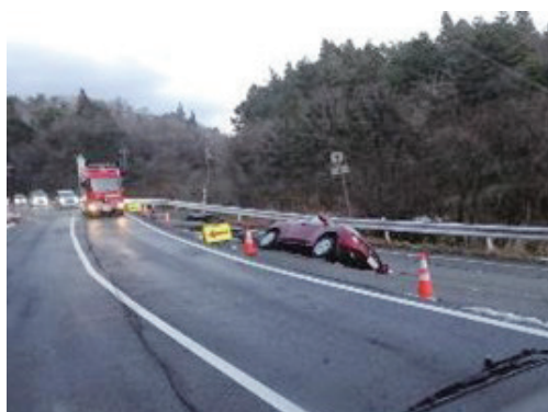
崩落した道路に落下した車両