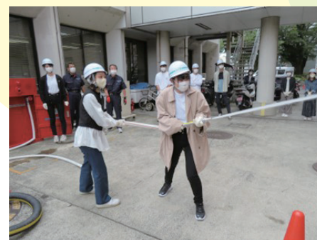
消火栓による 初期消火訓練

防災協会では、事業所の防災対策講習、各種訓練、非常食、保存水、防災用品の備蓄の相談、斡旋など各事業所の状況やご要望に応じて、ご協力させていただきます。