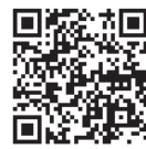
受付用アドレス QRコード