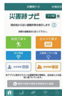
「災害時ナビ」トップ画面