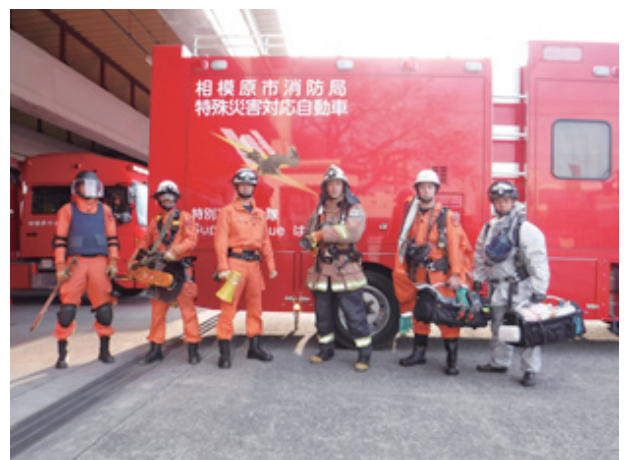
スーパーレスキューはやぶさ

特別高度救助隊（「スーパーレスキューはやぶさ」は相模原市の愛称です。）とは、「救助隊の編成、装備及び配置の基準を定める省令（総務大臣が定めた救助隊のルール）」に基づき、東京消防庁及び政令指定都市に配置しなければならない高度な救助器具、技術等を装備し、通常の救助活動や大規模災害に加え、テロなど特殊な災害にも対応する救助隊のことです。その他にも救助隊は、人口10万人以上の都市には「特別救助隊」を、中核市等には「高度救助隊」を配置するよう定められています。相模原市では、「特別高度救助隊1隊」、「高度救助隊1隊」及び「特別救助隊2隊」の合計4隊の救助隊を配置しています。