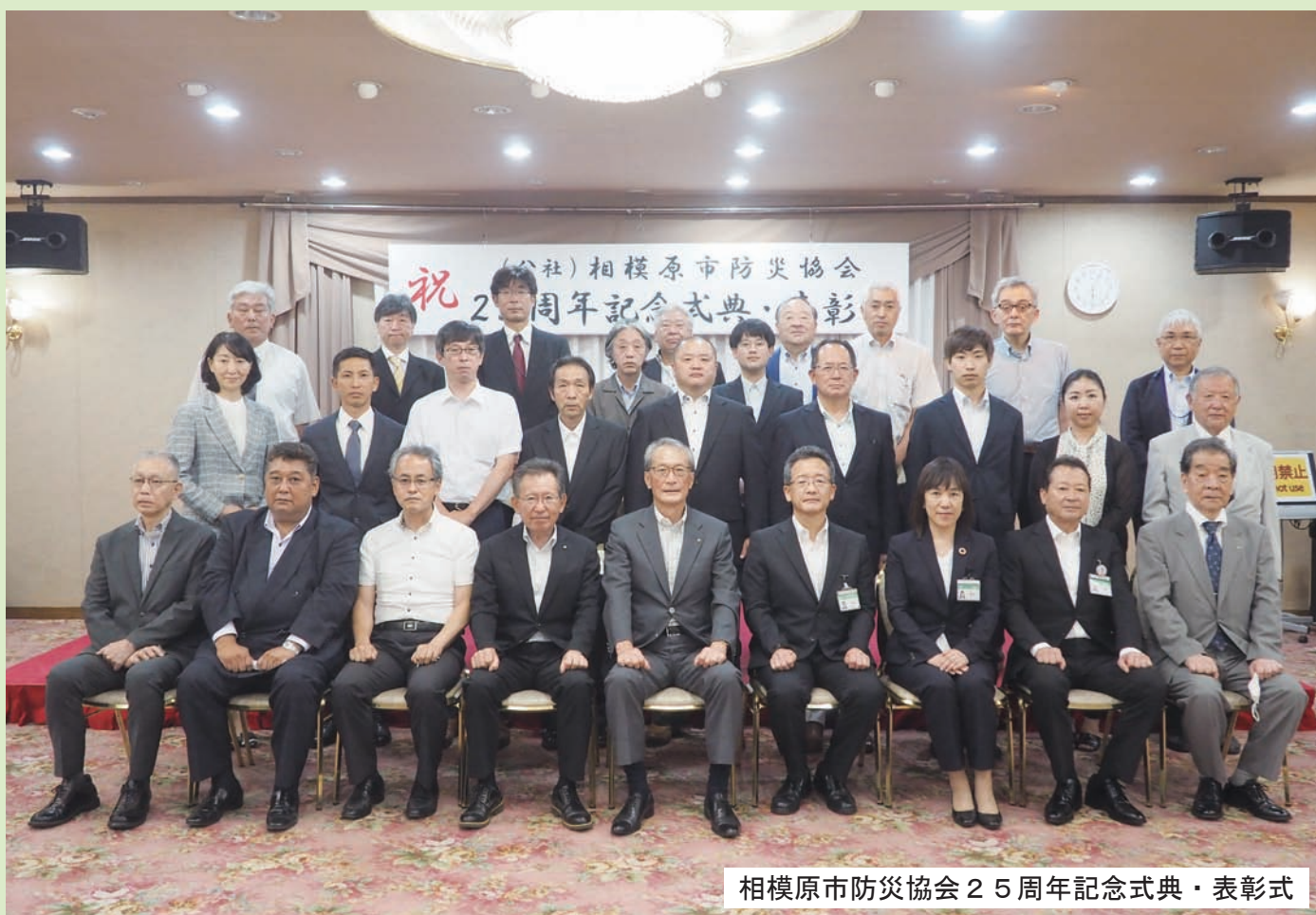
相模原市防災協会25周年記念式典・表彰式