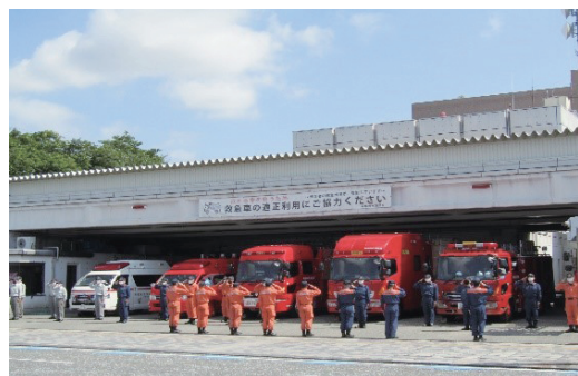
相模原消防署車庫前 (朝の職員の交代風景)

会員の皆様と連携し、市内の安全・安心の確保に努めてまいりますので、引き続き、ご理解・ご協力をお願いいたします。