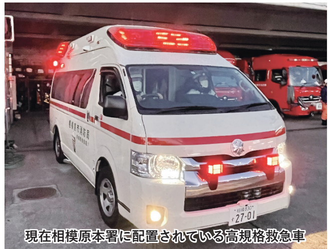
現在相模原本署に配置されている高規格救急車

救急資器材も進化 救急救命士が現場で実施できる処置の拡大に伴い、救急隊が扱う資器材も進化を遂げています。隊員は医療機関での研修や訓練により、知識と技術の習熟に努めています。