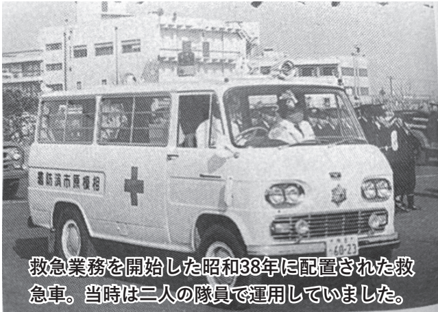
救急業務を開始した昭和38年に配置された救急車。当時は二人の隊員で運用していました。

市民の安全・安心を守る救急車は時代とともに進化しています。今回は救急車についてご紹介します。