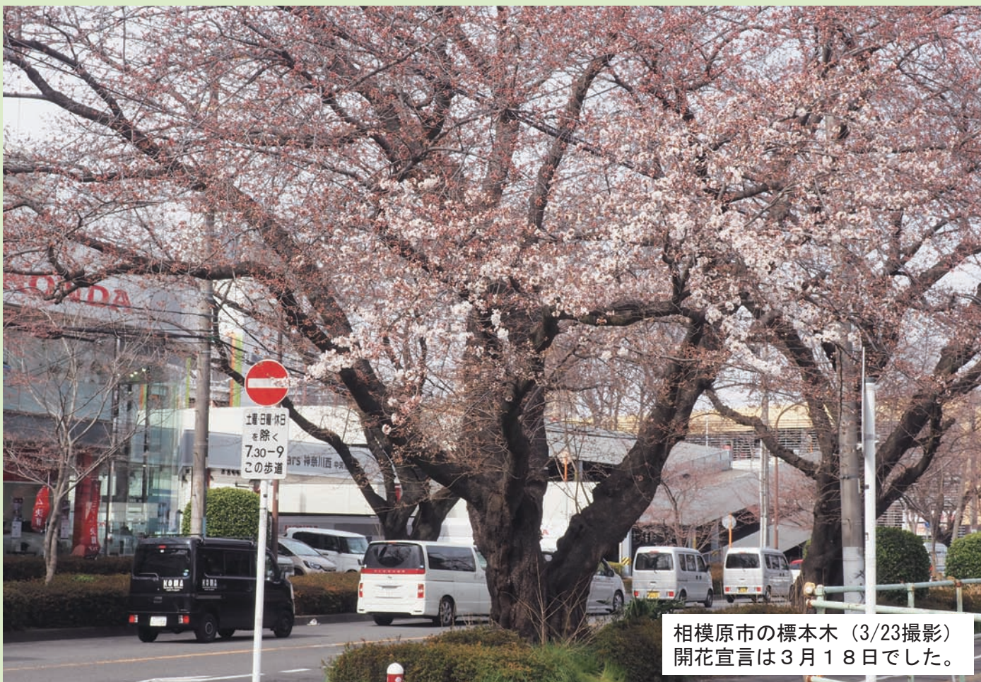
相模原市の標本木 (3/23撮影) 開花宣言は3月18日でした。