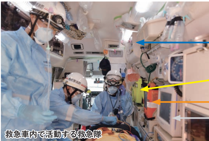
救急車内で活動する救急隊

救急資器材も進化 救急救命士が現場で実施できる処置の拡大に伴い、救急隊が扱う資器材も進化を遂げています。隊員は医療機関での研修や訓練により、知識と技術の習熟に努めています。