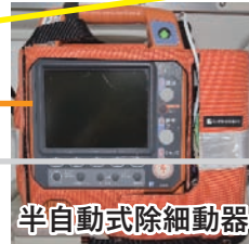
半自動式除細動器