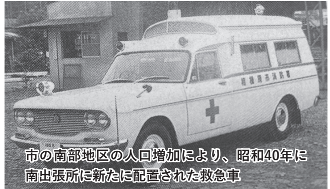
市の南部地区の人口増加により、昭和40年に南出張所に新たに配置された救急車