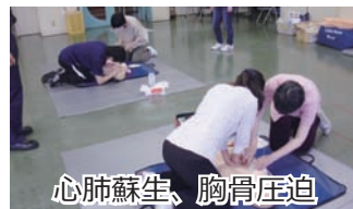
心肺蘇生、胸骨圧迫