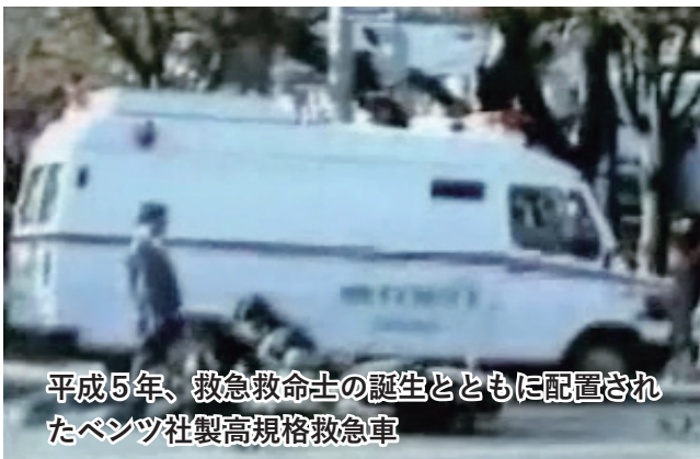
平成5年、救急救命士の誕生とともに配置されたベンツ社製高規格救急車