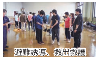
避難誘導、救出救護