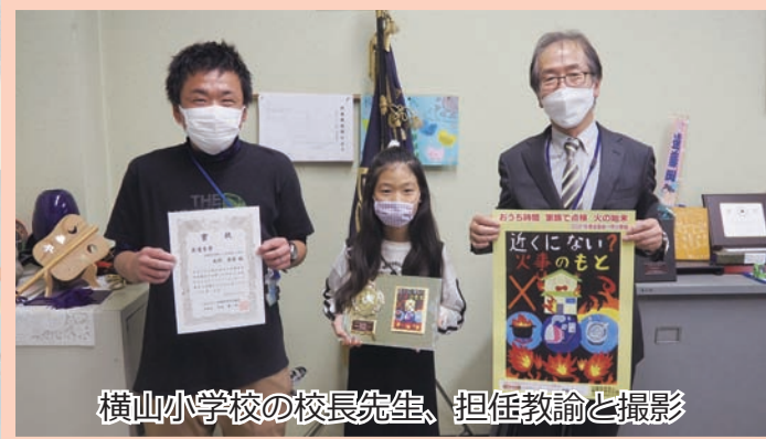
横山小学校の校長先生、担任教諭と撮影