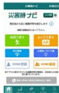
「災害時ナビ」トップ画面