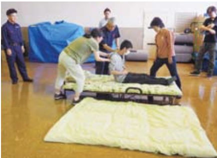
ベッドからの搬送