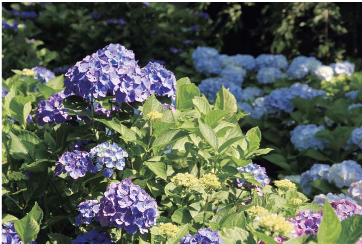
相模原北公園 あじさい