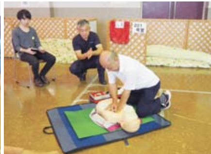
心肺蘇生、AEDの取扱い