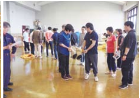
避難誘導、救出要領