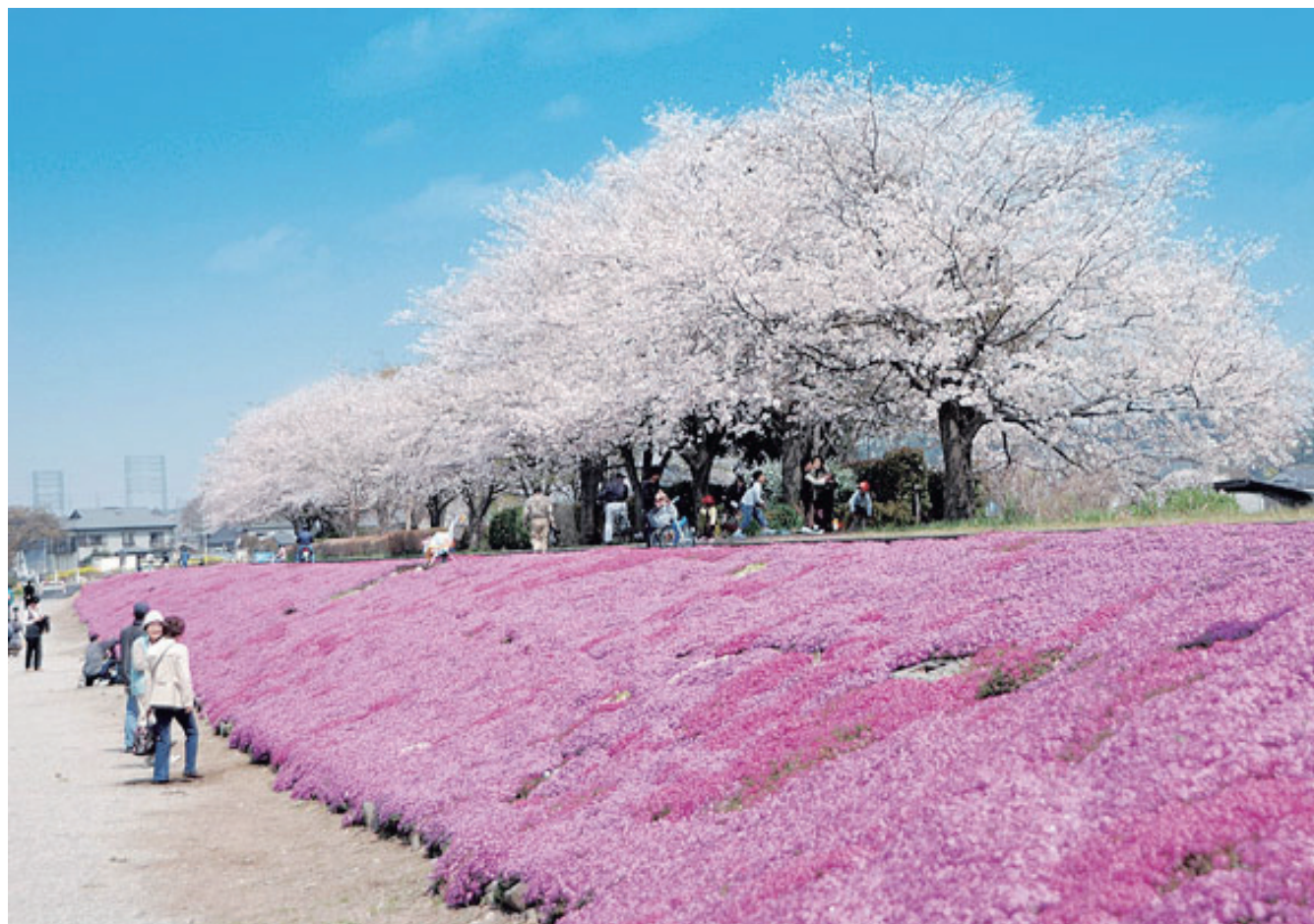
相模川新磯地区 芝ざくらライン