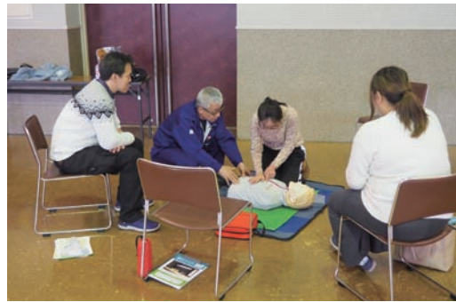
心肺蘇生、AED取扱い訓練