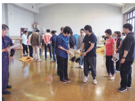
避難誘導、救出要領