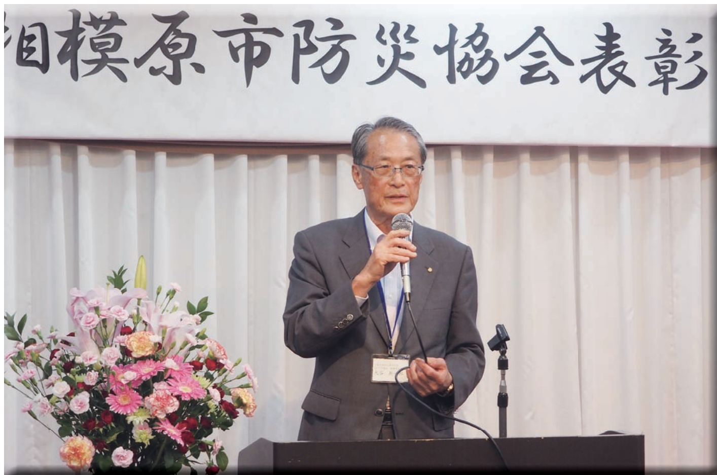
防災協会表彰式（相模原市民会館）