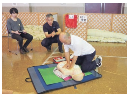
心肺蘇生、AEDの取扱い