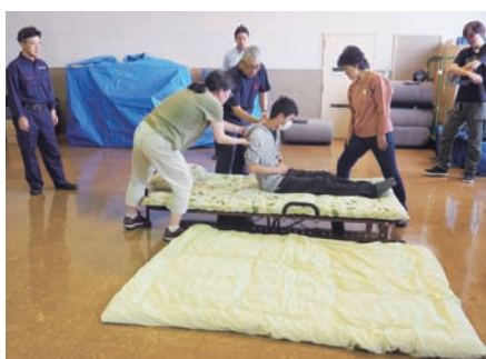
ベッドからの搬送