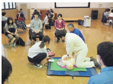
心肺蘇生・AED取扱い訓練