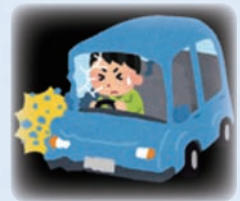
交通事故 (強い衝撃を受けた)