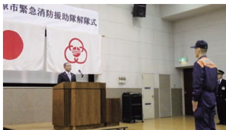
市長への帰庁報告