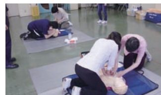
心肺蘇生、胸骨圧迫

日 時：令和6年5月28日(火)、29日(水)、30日(木)のいずれか1日 9時30分～16時45分