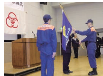
緊急消防援助隊旗返還