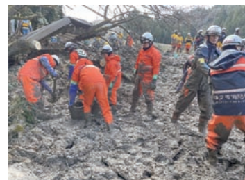
搜索・救助活動状況