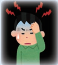
突然の激しい頭痛