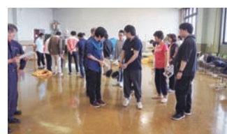
避難誘導、救出救護