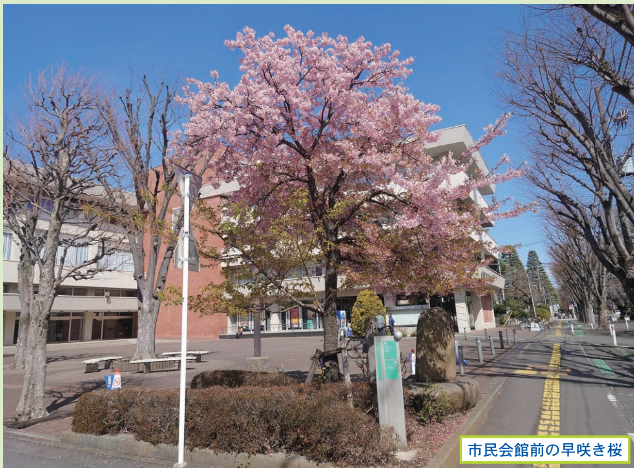
市民会館前の早咲き桜