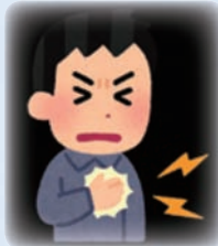
胸が激しく痛む (持続する胸痛)