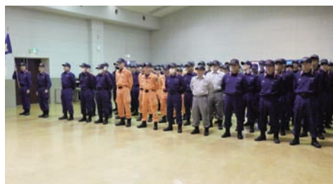
緊急消防援助隊解隊式