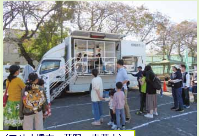
防火防災フェアを行いました(アリオ橋本、藤野、青葉小)