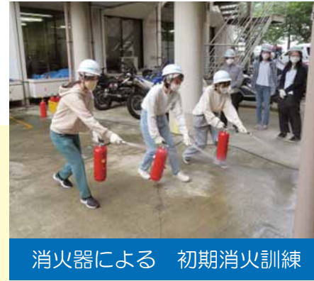
消火器による 初期消火訓練