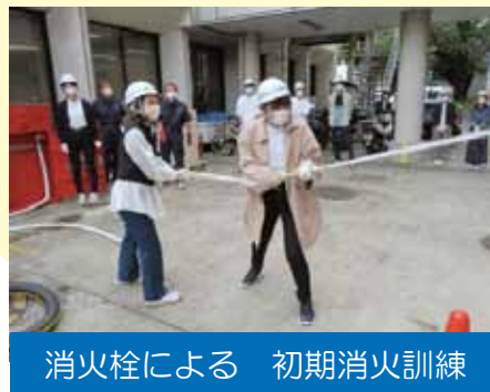
消火栓による 初期消火訓練