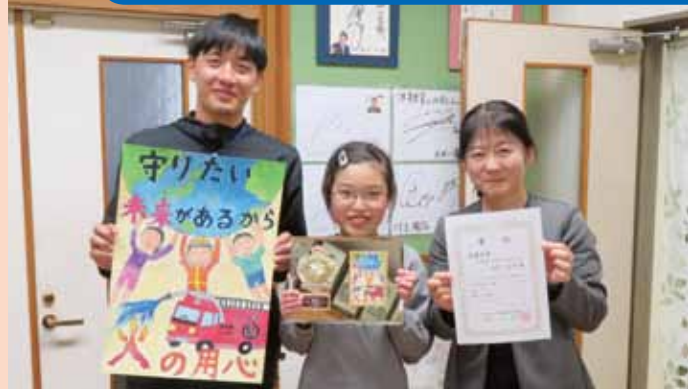
南大野小学校の校長先生、担任教諭と撮影