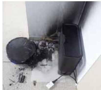
ロボット掃除機から出火