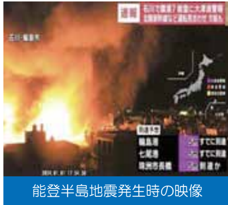
能登半島地震発生時の映像