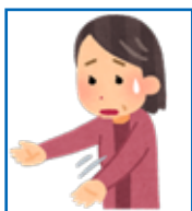
手が保持できない