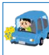
交通事故（強い衝撃を受けた）